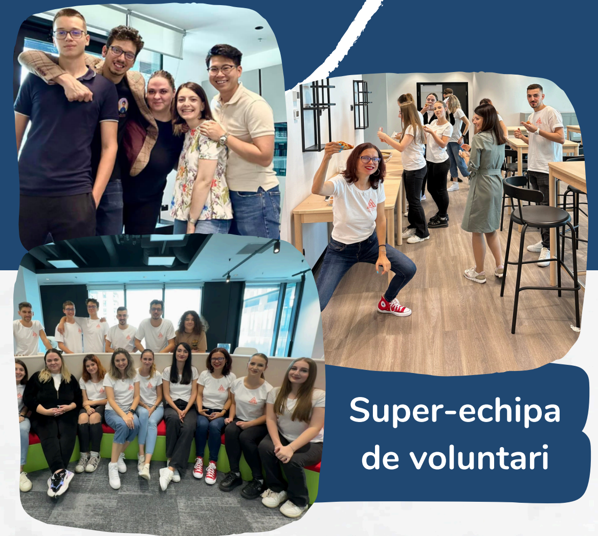
Super-echipa de voluntari