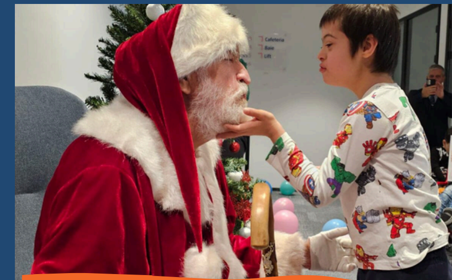
Decembrie-2023 Petrecere Craciun “Mos Craciun la Supereroi”