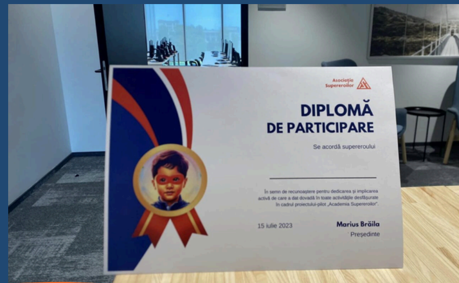
Iulie-2023 Festivitate absolvire