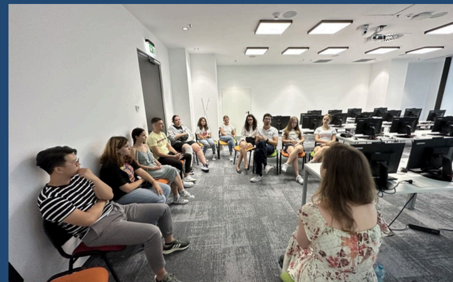
Iulie-2023 Workshop voluntari “Identificarea limitelor”